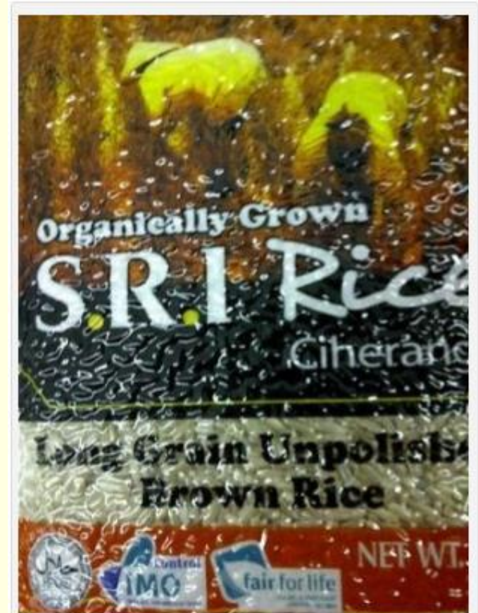
SRI Rice, beras dewi sri Indonesia di supermarket klcc Kuala Lumpur, dok rudi esape